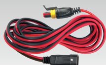
Rallonge 2.5 m - 029057